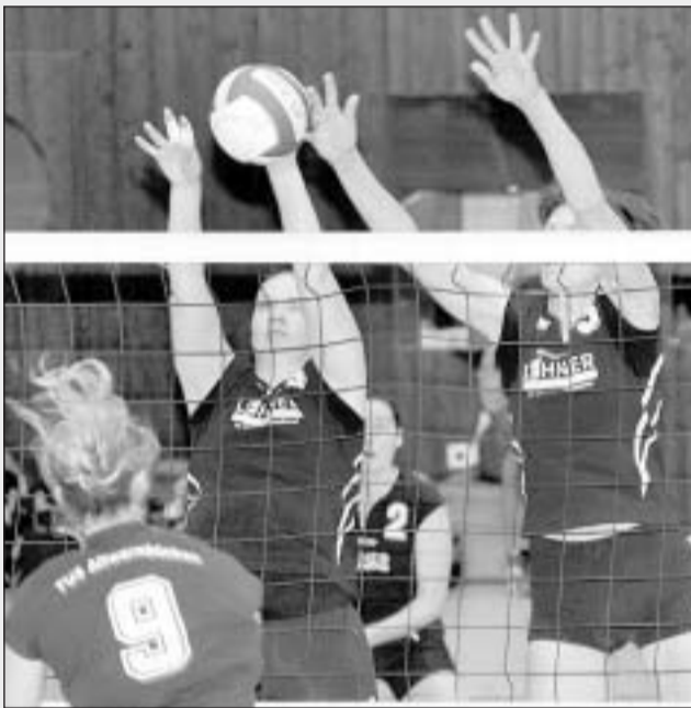
Schwerer Start: Die Verbandsliga-Volleyballerinnen des MTV Gifhorn müssen in Goslar ran.