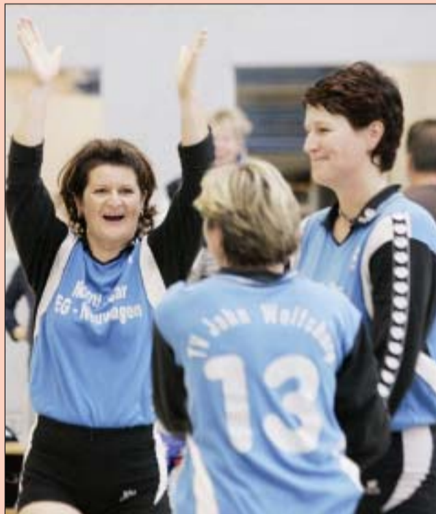
Maximale Ausbeute: Die Landesliga-Volleyballerinnen des TV Jahn Wolfsburg bejubelten zwei 3:0-Heimsiege.

TV Jahn Wolfsburg – TSV Bodenstedt II 3:0. Gegen den TSV wechselte Warzecha seine Truppe munter durch und brachte dennoch keine Unruhe ins Team. „Jede Spielerin hat sich ohne Probleme eingefügt“, lobte Wolfsburgs Trainer. So fuhr der TV Jahn auch in der zweiten Partie einen ungefährdeten 3:0-Erfolg ein und holte sich damit die maximale Ausbeute aus dem Wochenende. Warzecha: „Ich muss der Mannschaft wirklich ein Kompliment machen. Das war mein absolutes Wunschergebnis.“ Wunsch erfüllt!