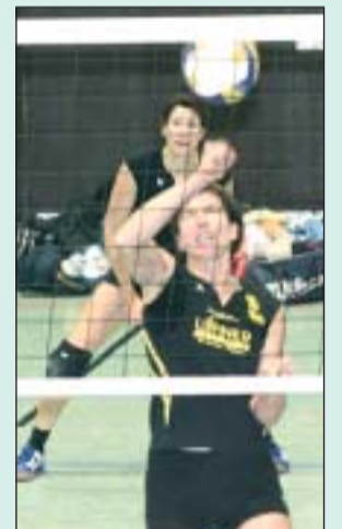
Top-Start: Der MTV Gifhorn siegte 3:0 in Goslar.