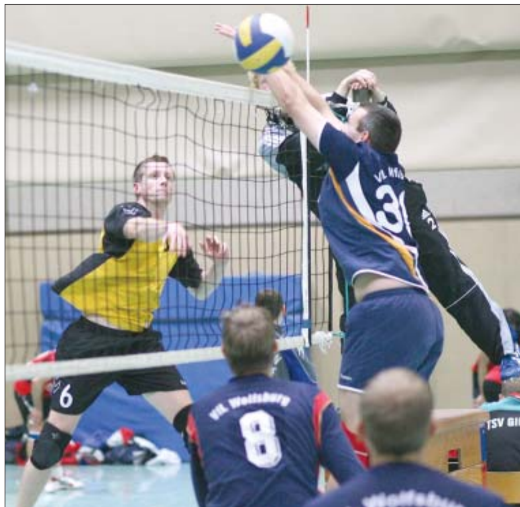
Auswärtspleiten: Der MTV Gifhorn (l.) unterlag bei der GfL Hannover mit 1:3, der VfL Wolfsburg beim VfL Lintorf II mit 2:3.