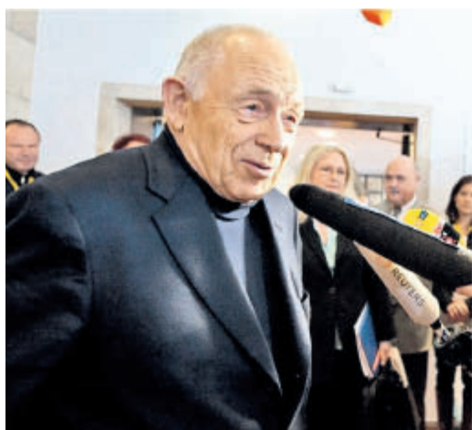
Streit um „Stuttgart 21“: Vermittler Heiner Geißler sprach sich für eine Fortführung des Projekts aus.

Umstrittenes Bauprojekt: Viele Kritikpunkte berechtigt, Abbruch wäre aber zu teuer