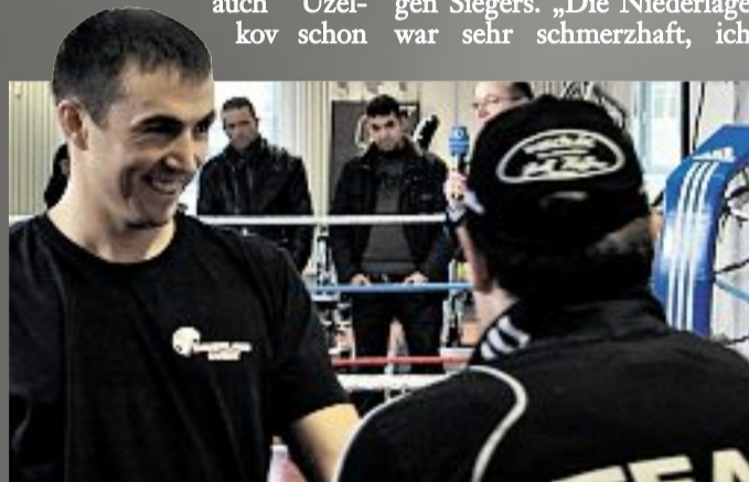
„Mein Ziel ist es, Europameister zu bleiben“: Eduard Gutknecht ist vor dem morgigen Kampf optimistisch.