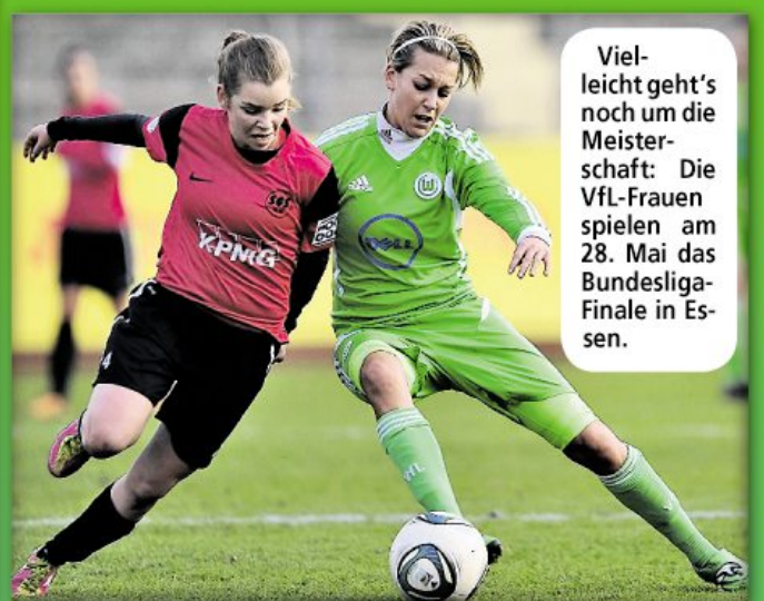
Vielleicht geht's noch um die Meisterschaft: Die VfL-Frauen spielen am 28. Mai das Bundesliga-Finale in Essen.