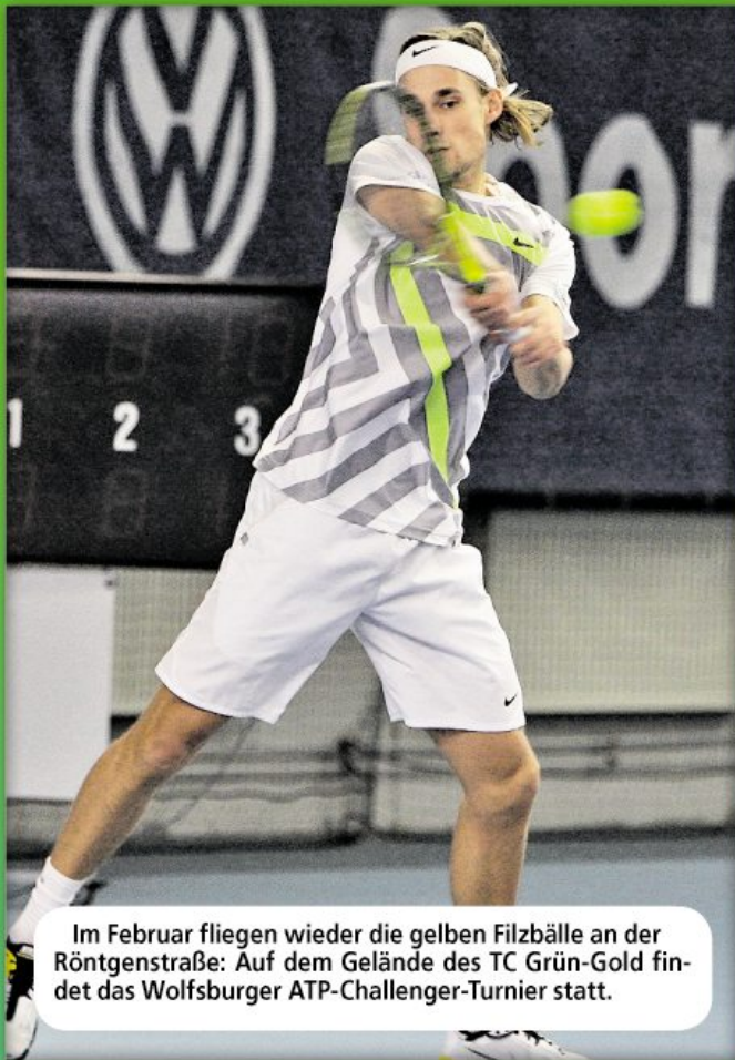
Im Februar fliegen wieder die gelben Filzbälle an der Röntgenstraße: Auf dem Gelände des TC Grün-Gold findet das Wolfsburger ATP-Challenger-Turnier statt.