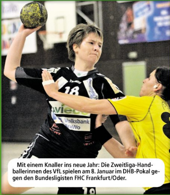
Mit einem Knaller ins neue Jahr: Die Zweitliga-Handballerinnen des VfL spielen am 8. Januar im DHB-Pokal gegen den Bundesligisten FHC Frankfurt/Oder.