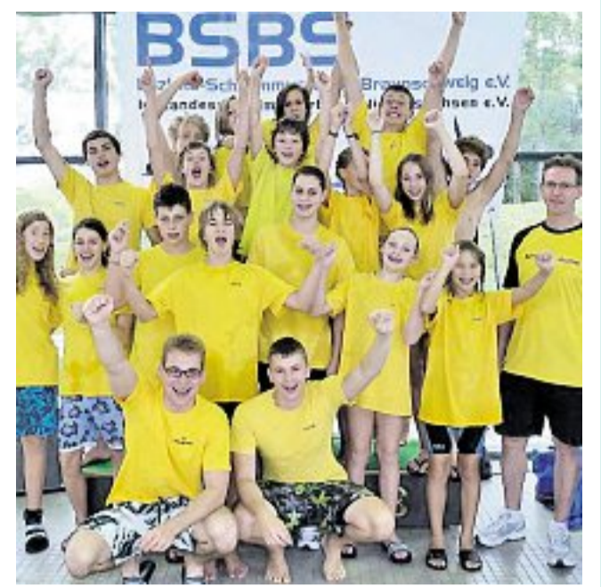
Sie waren augenscheinlich sehr zufrieden: Die Schwimmer des MTV Gifhorn starteten in Goslar.