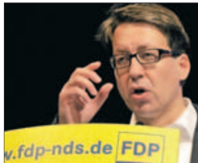
Der frisch gewählte FDP-Landesvorsitzende, Stefan Birkner.

Birkner erhielt bei der Wahl zum neuen Landesvorsitzenden 222 von 254 Stimmen. Vorgänger Philipp Rösler gab den Posten ab, da er zum FDP-Bundesvorsitzenden aufgestiegen war. Rösler räumte ein, das Kommunalwahlergebnis in Niedersachsen sei eine Aussage gegen die