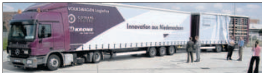
Bereits vor vier Jahren gab es einen Versuch mit Lang-LKW in Niedersachsen. Die Wolfsburger Spedition Schnellecke war beteiligt.

Doch mehrere Länder sperren sich gegen Ramsauers Feldversuch. Der Lobbyverband Allianz pro Schiene will die Pläne notfalls sogar gerichtlich stoppen. Um die Lang-LKW tobt ein Glaubenskrieg, der bis hinein ins Vokabular reicht. Befürworter wie der Niedersächsische In-